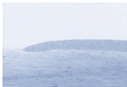
Gleichmässige Re-Epithelialisierung 8 Stunden nach experimentellem Epitheldefekt

In einem Modell der Wundheilung von Hornhaut-epithel 1,3 , in dem wir bereits früher eine Reihe von Contactlinsen-Pflegemitteln als teilweise epithelfeindlich gefunden hatten 2 , zeigte die Lösung „lid & lens“ keine Hemmung der epithelialen Wundheilung 4 . Somit ist eine normale Regenerationsmöglichkeit der beim Contactlinsenträger immer wieder vorkommenden Mikroläsionen des Hornhaut-epithels möglich.