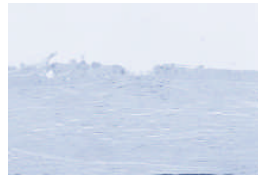
Fast vollständiger Epithelschluss mit leichter, passagerer unregelmässigkeit am Wundrand